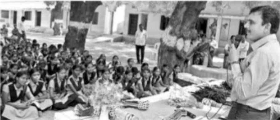
ప్రభుత్వ పాఠశాలలో విద్యార్థులకు బోధిస్తున్న జిల్లా కలెక్టర్