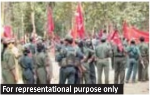
For representational purpose only

Karimnagar: For the past few days, a message is being circulated in social media that Maoists' activities are going on in Satavahana University (SU) in Karimnagar city. The message, posted in the name of 'Maoist-Affected Families Welfare Union', stated that one of the student organisations, which is working for the banned Maoist organisation, is involved in the recruitment process from the past few months targeting university students. After the message became viral on social media, the police started enquiring about the organisation.